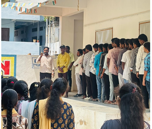
పోటీ పడలేక దశాబ్ద కాలం పాటు వెనుకబడి పోతున్నామని వాటిని అధిగమించడానికి యగ్ ఇండియా ఇంటిగ్రేటెడ్ రెసిడెన్షియల్ స్కూల్స్ ప్రవేశపెడుతున్న వారిని మంత్రి తమ ప్రసంగంలోనూ ప్రస్తావించారని విమర్శలు గుప్పారు.