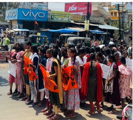
యగ్ ఇండియా ఇంటిగ్రేటెడ్ రెసిడెన్షియల్ స్కూల్స్ ఏర్పాటుని ఎబివిపి స్వాగతిస్తున్నదని, ఒకవైపు 8000 వేల కోట్ల ఫీ రీయంబర్స్మెంట్ స్కాలర్షిప్ బకాయిల వల్ల విద్యార్థులు కనీసం సర్టిఫికేట్లు తీసుకోవడానికి కూడా అరిగోస పడుతుంటే యాజమాన్యాలు వేధింపులు తట్టుకోలేక విద్యను మధ్యలోనే ఆపేస్తుంటే బడ్జెట్లో కనీసం కేటాయింపులు చేయకుండా వారి భవిష్యత్తును అంధకారంలోకి నెట్టేసిందని అన్నారు.