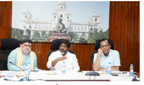
అందించామని, ఉద్యోగాలు రానటువంటి యువత వారి కాళ్ళ మీద వారు ఆర్థికంగా నిలబడటానికి రాజీవ్ యువ వికాస పథకం ద్వారా స్వయం ఉపాధి పథకాలు అందించాలని తీసుకున్న నిర్ణయాన్ని క్షేత్రస్థాయిలో విజయవంతంగా అమలు చేయడానికి అధికారులు

ఇందిరమ్మ రాజ్యంలోని ప్రజా ప్రభుత్వం ప్రతిష్టాత్మకంగా అమలు చేస్తున్న రాజీవ్ యువ వికాస పథకం ద్వారా యువత జీవితాల్లో మార్పు తీసుకురావడం కోసం అధికారులు అంకితభావంతో పని చేయాలని రాష్ట్ర ఉప ముఖ్యమంత్రి భట్టి విక్రమార్క నిర్దేశించారు. శనివారం అసెంబ్లీ కమిటీ హాల్ లో బీసీ సంక్షేమ శాఖ మంత్రి పొన్నం ప్రభాకర్ తో కలిసి రాజీవ్ యువ వికాస పథకం అమలు గురించి సంబంధిత అధికారులతో సమీక్ష సమావేశం నిర్వహించారు. రాష్ట్రంలో ప్రజా ప్రభుత్వం అధికారంలోకి వచ్చిన తర్వాత సుమారు 59 వేల మంది పైగా ఉద్యోగ నియామక పత్రాలు