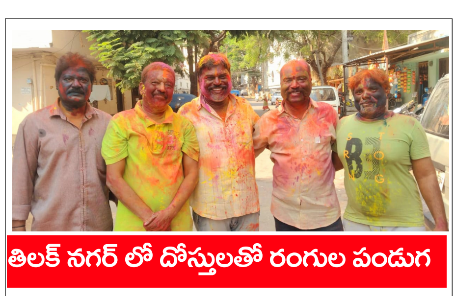
తిలక్ నగర్ లో దోస్తులతో రంగుల పండుగ