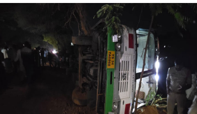
పరిగిలో ఆర్టీసీ బస్సు పట్టి పడిన దృశ్యం