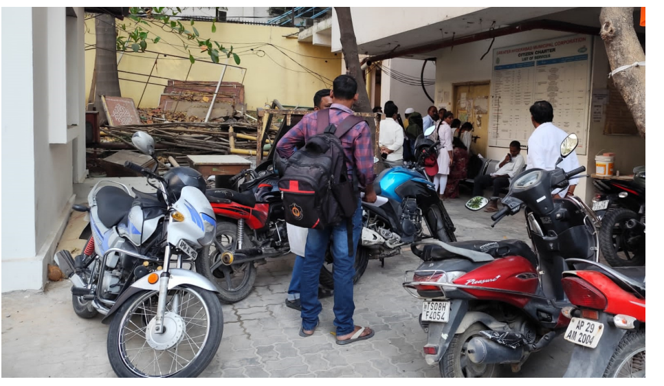
లంచ్ టైం పేరుతో గంటలకొద్దీ ముచ్చట్లు ..