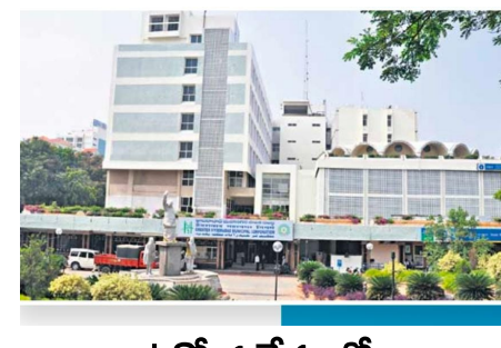
ఉద్యోగ వేళలలో ఎప్పుడు వస్తారో ఎప్పుడు వెళ్తారో..

జిహెచ్ఎంసి లోని సిబ్బంది, అధికారులు వాళ్ళకు ఉద్యోగ సమయం అంటూ ఏది లేదు. ఫీల్డ్ వర్క్ పేరుతో కొందరు అధికారులు సిబ్బంది కార్యాలయానికి రాకుండానే తమ సొంత పనులు నిర్వహించుకుంటూనే ఉన్నారు. ఆఫీసులో కూర్చున్న వాళ్ళు కూడా ఏ సమయానికీ వస్తారో ఏ సమయానికీ వెళ్తారో ఎవరికీ తెలియదు ఇక వీళ్ళకు బయోమెట్రిక్ లేకపోవడంతో అడిగి నాడుడే లేకుండా పోయాడు. వాళ్ళు ఎప్పుడు వచ్చినా రిజిస్ట్రేషన్ సిగ్నల్ పెడతారు కొందరు అధికారులు అయితే అసలు ఆఫీసుకు రాకుండానే సిగ్నల్ పెట్టి మమ