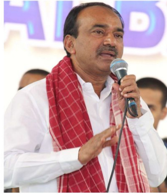
నిరుద్యోగం వేగంగా బీజేపీ ప్రభుత్వం బడ్జెట్లో రూ. 4 లక్షల

సిద్దిపేట జిల్లా: పార్లమెంటు ఎన్నికల్లో మూడో సారి సరేంద్ర మోదీకి ప్రజలు అధికారం కట్టబెట్టారని, ప్రతిపక్షాల తీరు పార్లమెంటులో విచిత్రంగా ఉందని ప్రజానీకం అంతా ఒకటే భావనతో అన్నారు. మంత్రి గిరి బీజేపీ ఎంపీ ఈటెల రాజేందర్ అన్నారు. ఆదివారం సిద్దిపేట జిల్లా, గజేల్ పట్టణంలో ఆయన మీడియా సమావేశంలో మాట్లాడుతూ.. దేశం సుభిక్షంగా ఉండాలన్నా, ఆర్థికంగా, బలంగా ఉండాలన్నా, ప్రపంచంలో దేశం సగౌరవంగా ఉండాలంటే మోదీ ప్రధానిగా ఉండాలనేది ప్రజలకు తెలుసునని అన్నారు. ఇటీవల జరిగిన తెలంగాణ ఎన్నికల్లో కాంగ్రెస్ కు 44 శాతం వస్తే.. బీజేపీకి 30 శాతం ఓట్లు వచ్చాయిన్నారు. ఇప్పుడు తెలంగాణలో జరిగే ఎమ్మెల్యే ఎన్నికల్లో ప్రజలు మోదీని ఆశీర్వదించే విధంగా కనిపిస్తోందని ఈటెల రాజేందర్ అన్నారు. ఉపాధ్యాయులకు అందగా కొట్టాడిన పార్టీ బీజేపీ అని, దీనివల్ల విషవల్ల, మధ్యతరగతి వారి విషయంలో బీజేపీ కృషిచేసిందని పేర్కొన్నారు. నిరుద్యోగ సమస్య దేశంలోనే కాకుండా ప్రపంచ వ్యాప్తంగా తాండవిస్తోందని, ప్రపంచంలో 11 వ ఆర్థిక వ్యవస్థలో ఉన్న భారత్ మోదీ కృషితో 5 వ స్థానానికి వచ్చిందన్నారు. నిరుద్యోగ సమస్యను సంపూర్ణంగా