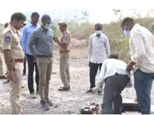
ఈ నెల 3న అధ్యక్షమైనట్లు వనస్పతిపురంలో ప్రణాళికతో దాడి చేసిన హతమార్చడంతో ఈ ఘటన