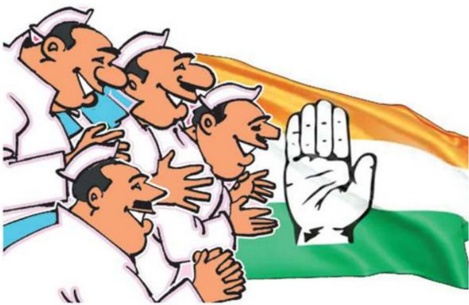
ప్రజావినికడి, హైదరాబాద్ :

తెలంగాణలో కాంగ్రెస్ ప్రభుత్వం ఏర్పడి ఏడాది గడిచింది. కేబినెట్ 12 మందితో ఏర్పడింది. ఆరు పోస్టులు ఇంకా ఖాళీగా ఉన్నాయి. ఈ నేపథ్యంలో తాజాగా వాటి భర్తీకి లైన్ క్లియర్ అయింది. తెలంగాణలో కాంగ్రెస్ ప్రభుత్వం ఏర్పడి ఏడాది పూర్తయింది. ఈ నేపథ్యంలో క్యాబినెట్ బెర్తుల ఖాళీలు భర్తీ చేసేందుకు హైదరాబాద్ గ్రీన్ సిగ్నల్ ఇచ్చింది.