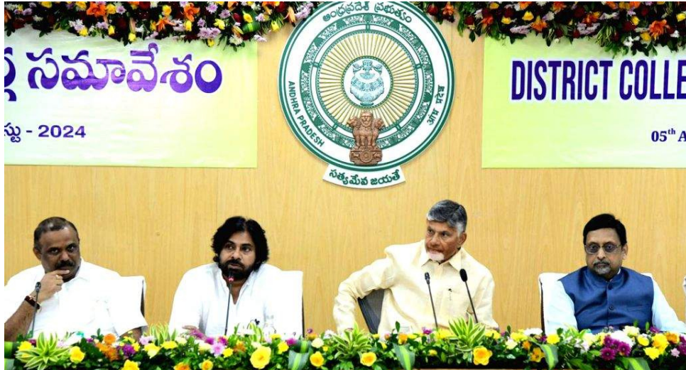
అమరావతి డిసెంబర్ 11, ప్రజావినికిడి: వైజాగ్ లో గూగుల్ ఏర్పాటు..

జిల్లా కలెక్టర్ తో ఏపీ ప్రభుత్వ సమావేశం హాజరైన సీఎం చంద్రబాబు, డిప్యూటీ సీఎం పవన్ కల్యాణ్