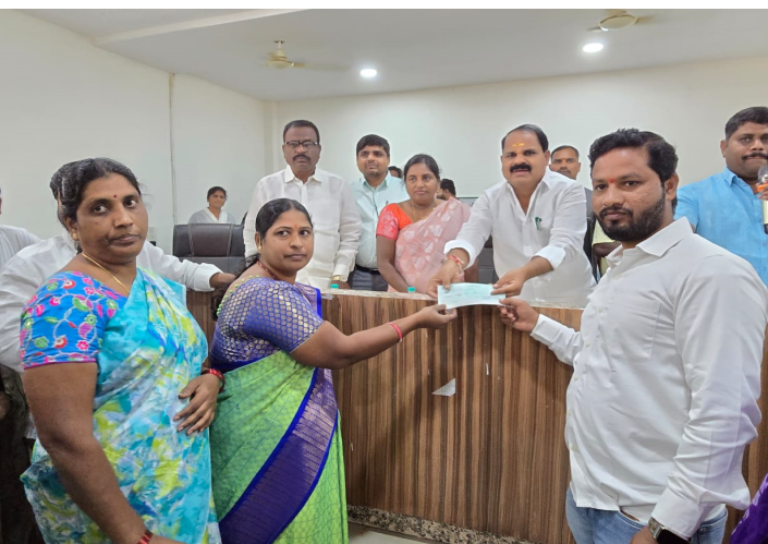
ప్రజావినికిడి, (షాద్ నగర్):