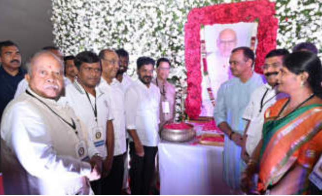
రోశయ్యే అన్నాను.సీఎం కావాలని రోశయ్య ఎప్పుడూ కోరుకోలేదని, కానీ సమయం వచ్చినప్పుడు సోనియాగాంధీ

తమిళనాడు గవర్నర్ గా అద్యుతంగా పని చేశారన్నారు. పాలకవక్రంలో ఉంటే ప్రతిపక్షాన్ని.. ప్రతిపక్షంలో ఉంటే అధికార పార్టీని, సీఎంను ఇరుకున పెట్టే విధానాన్ని ఆయన నుంచి నేర్చుకోవాలన్నారు.అప్పుడు ఎవరు ముఖ్యమంత్రులుగా ఉన్నా.. నెంబర్ 2 షాజిషన్ మాత్రం రోశయ్యదే అని గుర్తు చేశారు. నెంబర్ వన్ లో ఉన్న సీఎం మాత్రమే మారుతుండేవారన్నారు. మర్రి చెన్నారెడ్డి, నేదురమల్లి జనార్దన్ రెడ్డి, భవనం వెంకట్రామ్, అంజయ్య, కోట్ల విజయభాస్కర్ రెడ్డి, వైఎస్ రాజశేఖరరెడ్డి.. ఇలా ఎందరో సీఎంల వద్ద నెంబర్ 2గా ఉన్నారున్నారు. వీరంతా ప్రభుత్వాన్ని ప్రశాంతంగా నడిపించడానికి కారణం