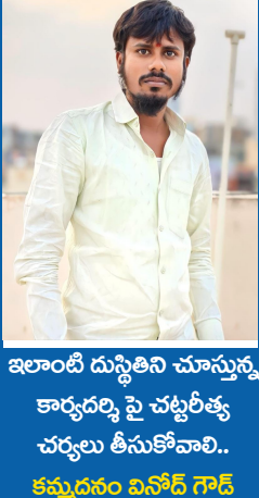
ఇలాంటి దుస్థితిని చూస్తున్న కార్యదర్శి పై చట్టరీత్యా చర్యలు తీసుకోవాలి.. కమ్యూనిటీ విన్ గాడ్

మీకు గ్రామ సమస్యలు పట్టవా ఎన్నీ కాలనీలో బోరుబావి పక్కనే ఇందిరమ్మ కాలనీలో బోరుబావి పక్కనే పిచ్చి మొక్కలు మొలసిన అపరిశుభ్రత కారణంగా గ్రామస్తులు రోగాల బారిన పడే ప్రమాదం ఉంది గ్రామపంచాయతీ కార్యదర్శి గ్రామ పంచాయతీకి ఎప్పుడు వస్తారు ఎప్పుడు వెళ్తారో తెలియడం లేదు పత్తాలేని పంచాయతీ కార్యదర్శి ఉన్నట్టా లేనట్టా గ్రామంలో పిచ్చి మొక్కలు చెత్త చెదారం కలుషిత తాగునీరు తాగి గ్రామస్తులు రోగాల బారిన పడే ప్రమాదం ఉంది ఇప్పటికైనా ఉన్నత అధికారులు గ్రామ పంచాయతీ కార్యదర్శి పై విచారణ జరిపి చట్టరీత్యా చర్యలు తీసుకోవాలని గ్రామ ప్రజలు అందరి తరపున డిమాండ్ చేస్తున్న కమ్యూనిటీ విన్ గాడ్ మీడియా కు తెలిపారు.