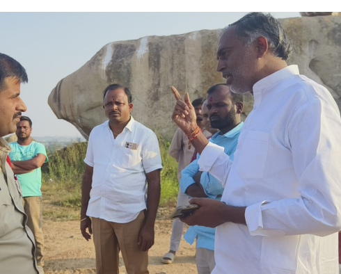
భయంతో చచ్చే కన్నా.. ఒకేసారి చంపేయండి.