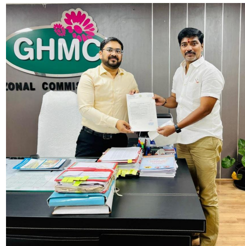
వున్నటువంటి సమస్యలను పరిష్కరిస్తామని హామీ ఇచ్చారు.

హెచ్ఎండివి అనుమతులు కూడా వున్నాయని హైద్రా చర్యలు వెనక్కి తీసుకునేలా చొరవ తీసుకోవాలని తెలియజేశారు. అనంతరం జోనల్ కమిషనర్ సత్యనగర్ అపార్ట్మెంట్ కి సంబంధించిన పైల్ పక్కకు పెట్టడం జరిగిందని కార్పొరేటర్ కు తెలియజేశారు. అనంతరం డివిజన్ లో నూతన సీసీ రోడ్డు నిర్మాణం కమ్యూనిటీ హాల్ నిర్మాణాలు చేయించాలని కోరారు. కొత్తపేటలో విడి దీపాల కొరత ఎక్కువగా ఉందని తెలియజేశారు, కొత్తపేట విలేజ్, ఓల్డ్ కొత్తపేట, సత్యనగర్ జనప్రియలో ఐమాక్స్ మోడ్రన్ లైట్స్ మరమ్మతులు చేయించాలని తెలియజేశారు. అనంతరం డివిజన్ లో వున్నటువంటి వివిధ సమస్యలను వివరించారు. అనంతరం డివిజన్లో