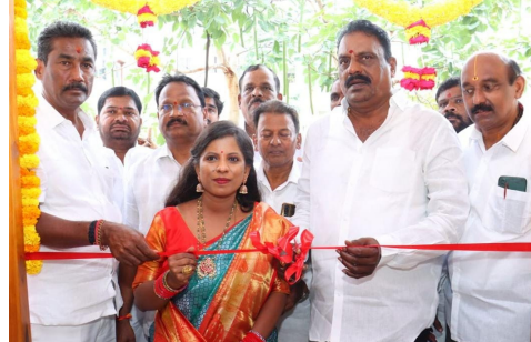
చేసిన నూతన క్రేన్ ఆయన ప్రారంభించారు. ఒక కోటి అంచనావేయంతో వట్టినాగులపల్లి లో డంపింగ్ యార్డ్ వద్ద కంపోస్ట్ పెద్దు సిసి రోడ్డు నిర్మాణ పనులను ఆయన శంకుస్థాపన చేశారు. అన్ని