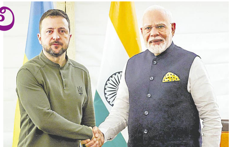
ప్రధానమంత్రి మోదీ మూడు రోజుల అమెరికా పర్యటన విజయవంతంగా ముగిసింది. స్థానిక కాలమానం ప్రకారం సోమవారం న్యూయార్క్ నుంచి భారత్కు తిరుగుపయనమయ్యారు.

సిక్కులతో మోదీ సమావేశం ప్రధాని మోదీ న్యూయార్క్లో పలువురు సిక్కు పెద్దలతో సమావేశమయ్యారు. భారత్ లో సిక్కు సామాజిక వర్గం అభ్యున్నతికోసం ఎన్నో పథకాలు అమలు చేస్తున్నారంటూ మోదీకి సిక్కులు కృతజ్ఞతలు తెలిపారు. ముగిసిన మూడు రోజుల పర్యటన