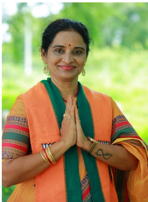
ప్రజావినికిడి, (రంగారెడ్డి జిల్లా):

జగిత్యాల జిల్లా మెట్టుపెల్లి మండలం పెద్దపూర్ మరియు గొల్లపల్లి మండల కేంద్రంలోని కస్తూరిబా పాఠశాలలో విద్యార్థినులు కలుషిత ఆహారం తిని అస్వస్థత గురైన సంఘటన మరిచిపోక ముందే రంగారెడ్డి జిల్లాలోని శంషాబాద్ మండలం