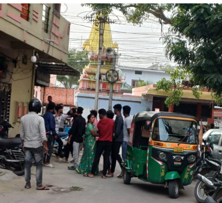
పట్టించుకోవడం లేదని వాపోతున్నారు. దేవాలయం వద్ద అర్ధరాత్రి పూట

ప్రజావినికిడి(రాజేంద్రనగర్): ఆగస్టు 12, రాజేంద్రనగర్ మైలర్ దేవుల పల్లి డివిజన్ పరిధిలోని భవాని కాలనీ స్ట్రీట్ నెంబర్ పోర్టులో శ్రీ శ్రీ శివాంజనేయ స్వామిదేవాలయం అసాంఘిక కార్యక్రమాలకు అడ్డాగా మారిన ఎవరు పట్టించుకోవడంలేదని వాలసీ వాసులు ఆందోళన వ్యక్తం చేస్తున్నారు.దేవాలయం వద్ద గంజాయి తాగడం, సిగరెట్లు తాగడం వంటి నీచమైన పనులు చేస్తున్న ఎవరు పట్టించుకోవడంలేదని భక్తుల ఆందోళన వ్యక్తం చేస్తున్నారు.అర్ధరాత్రి దాటితే చాలు అమ్మాయిలతో అసాంఘిక కార్యక్రమాలు జరుగుతున్నాయని కాలనీ వాసులు ఆగ్రహం వ్యక్తం చేస్తున్నారు. కాలనీవాసులు భక్తులు అధికారులకు పోలీసులకు ఫిర్యాదు చేసిన