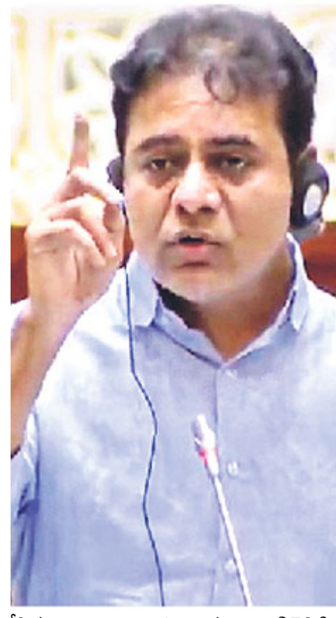
చేసినట్లు వ్యాఖ్యానించారు. బిజెపికి వ్యతిరేకంగా మాట్లాడుతుంటే మీకేం ఇబ్బందని కాంగ్రెస్ సభ్యులను ఉద్దేశిస్తూ కెటిఆర్ ప్రశ్నించారు.

మీరే చెబితే ఎట్లా ..? మంత్రిలను, స్పీకర్ ను ఉద్దేశించి కెటిఆర్ వ్యాఖ్యానించారు. రాష్ట్ర హక్కులను శాసించి సా ధించుకోవాలని, యాచిస్తే ఏమీ రాదని అన్నారు. కేంద్రం వివక్షను ఎండగట్టడంలో తాము సహకరిస్తామని తెలిపారు. ఇంతకాలానికి కాంగ్రెస్ సర్కారుకు ఢిల్లీ తత్వం బోధపడింది బిఆర్ఎస్ హయాంలో రాష్ట్రాన్ని ఎంతో అభివృద్ధి చేశామని, కేంద్రం నుంచి రావలసిన నిధుల కోసం శక్తివంతుల లేకుండా ప్రయత్నం చేశామని కెటిఆర్ అన్నారు. కేంద్రం సాయం చేయకపోయినా రాష్ట్రాన్ని ఎంతో అభివృద్ధి చేశామన్నారు. కాంగ్రెస్ ప్రభుత్వానికి ఇంతకాలానికి ఢిల్లీ తత్వం బోధపడిందని పేర్కొన్నారు. తెలంగాణ హక్కులు ఎవరు హరించినా వారి మెడలు వంచుతామని స్పష్టం చేశారు. విభజన సమయంలో తెలంగాణ హక్కుల కోసం ఎంతో పోరాడమని, మోడీ సర్కారుపై తెలంగాణ కోసం అనేక పోరాటాలు