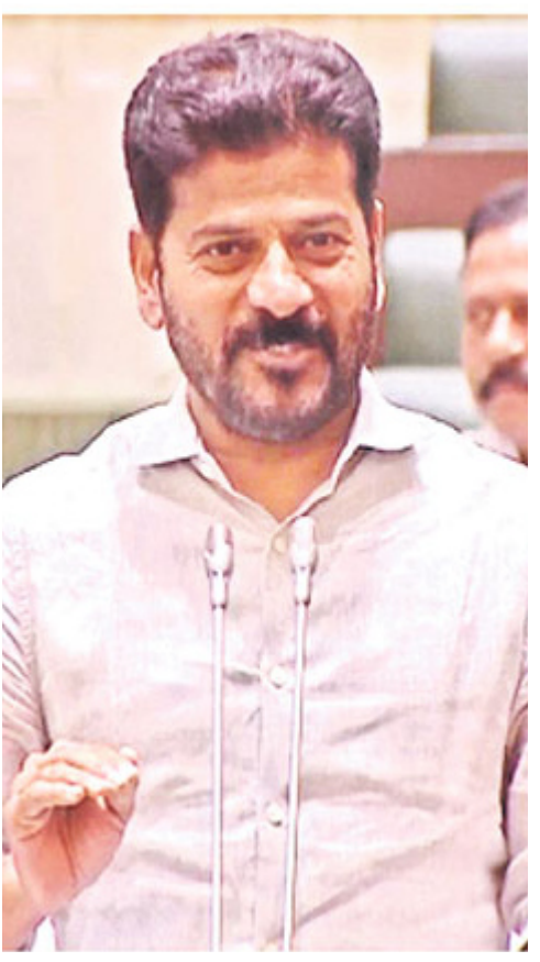
హైదరాబాద్ జూలై 24 ప్రజావినికిడి: కేంద్ర బడ్జెట్లో రాష్ట్రానికి నిధుల కేటాయింపు అంశంపై అసెంబ్లీ సమావేశాలు వాడివేడిగా సాగాయి. తెలంగాణ రాష్ట్రానికి కేంద్ర