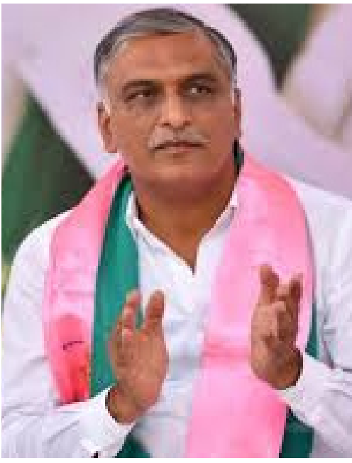
నిరుద్యోగులు, విద్యార్థి సంఘాల నాయకుల అరెస్టును ఖండించిన కేటీఆర్

నిరసన తెలియజేసే హక్కు కూడా నిరుద్యోగులకు లేదా అని ఈ సందర్భంగా హరిశ్ రావు ప్రశ్నించారు. తమ గోసను రిప్రజెంటేషన్ ద్వారా చెప్పుకునే అవకాశం కూడా లేదా అని నిలదీశారు. ఒక వైపు ప్రజా పాలన అని ప్రచారం చేసుకుంటూ నిరుద్యోగుల గొంతులను, హక్కులను రేవంట్ రెడ్డి సర్కార్ అణగదొక్కతోందని ఫైర్ అయ్యారు. ఇది ముమ్మాటికీ ప్రజాపాలన కాదని, అప్రజాస్వామ్యపాలన అని దుయ్యబట్టారు. ఉద్యోగాల కోసం వున్నకాలు పట్టుకుని చదవాల్సిన విద్యార్థులను నడిరోడ్డుకు ఈడ్చి ధర్మాల, ఆందోళనలు చేసే దుస్థితికి కాంగ్రెస్ ప్రభుత్వం తీసుకువచ్చిందని విమర్శించారు. ఎన్నికల ముందు హామీలు ఇచ్చి, అధికారంలోకి వచ్చిన తర్వాత ముఖం తిప్పుకుంటే విద్యార్థులకు నిరుద్యోగులకు తోడు ప్రధాన ప్రతిపక్షమైన బీఆర్ఎస్ పార్టీ చూస్తూ ఊరుకోదన్నారు. సమస్యలు పరిష్కరించే దాక, డిమాండ్లు సాధించే దాకా వదిలిపెట్టేది లేదని చెప్పారు. విద్యార్థులు, నిరుద్యోగుల తరపున గొంతెత్తడామని స్పష్టం చేశారు. నిర్విరామ పోరాటం చేస్తామన్నారు. విద్యార్థులు, విద్యార్థి సంఘాల నాయకులు, నిరుద్యోగుల అరెస్టులను తక్షణం నిలిపివేయాలని డిమాండ్ చేశారు. నిర్బంధించిన వారిని, అరెస్టు చేసిన వారిని వెంటనే విడుదల చేయాలని బీఆర్ఎస్ పార్టీ తరపున ప్రభుత్వాన్ని డిమాండ్ చేస్తున్నామని హరిశ్ రావు చెప్పుకొచ్చారు.