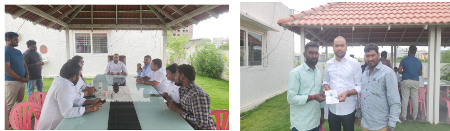
ప్రజావినికిడి,(కుత్బుల్లాపూర్):ప్రజా సమస్యల పరిష్కారమే ధ్యేయంగా ముందుకు వెళుతున్నామని

కుత్బుల్లాపూర్ నియోజకవర్గం బీఆర్ఎస్ నేత శంభీపూర్ క్రిష్ణ అన్నారు.కుత్బుల్లాపూర్ నియోజకవర్గ పరిధిలోని వివిధ ప్రాంతాలకు చెందిన ప్రజలు శుక్రవారం ఆయన కార్యాలయంలో మర్యాదపూర్వకంగా కలిసి తమ ప్రాంతాల్లో నెలకొన్న సమస్యలు పరిష్కరించాలని కోరగా వారు సానుకూలంగా స్పందించి ప్రజా సమస్యల పరిష్కారమే లక్ష్యంగా ముందుకు వెళుతున్నట్లు తెలిపారు.సంబంధిత అధికారులతో మాట్లాడిసమస్యలుపరిష్కరిస్తామన్నారు.