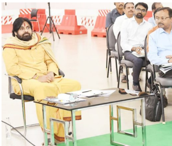
ఆలయానికి రానున్నారని. వారాహి దీక్షలో ఉన్న పవన్.. కొండగట్టు ఆంజనేయ దర్శించుకుని ప్రత్యేక పూజలు చేయనున్నారు. ఏపీ డిప్యూటీ సీఎం బాధ్యతలు చేపట్టాక తాలిసారి కొండగట్టుకు వస్తున్న పవన్ కల్యాణ్ కు జనసేన కార్యకర్తలు ఘన స్వాగతం పలికేందుకు ఏర్పాట్లు చేసుకుంటున్నారు. ప్రస్తుతం పవన్ కల్యాణ్ వారాహి దీక్షలో ఉన్న విషయం తెలిసింది. 11 రోజుల పాటు కొనసాగుతున్న ఈ దీక్షలో భాగంగా పవన్ కేవలం పండ్లు, పాలు మాత్రమే ఆహారంగా స్వీకరిస్తున్నారు.

అమరావతి జూన్ 26, ప్రజావినికిడి : గడిచిన ఐదేళ్లలో కేంద్ర ప్రభుత్వం విడుదల చేసిన రూ.1,066 కోట్లు ఏమయ్యాయని ఏపీ ఉపముఖ్యమంత్రి పవన్ కల్యాణ్ ప్రశ్నించారు. ఆయన బుధవారం స్వచ్ఛాంద్ర కార్పొరేషన్ పై సమీక్ష నిర్వహించారు. ఈ సమావేశానికి ఉన్నతాధికారులు, ఇంజనీర్లు హాజరయ్యారు. కార్పొరేషన్ పనితీరుపై ఉపముఖ్యమంత్రికి అధికారులు పవన్ పాయింట్ ప్రజెంటేషన్ ఇచ్చారు. అనంతరం, ఆయన స్వచ్ఛాంద్ర కేంద్రం నుంచి వచ్చిన నిధులు, ఖర్చుల వివరాలపై ఆరా తీశారు. అయిదేళ్లలో కేంద్రం నుంచి వెయ్యి కోట్లకు పైగా వచ్చినట్లు గుర్తించారు. ఈ నిధులు ఎక్కడకు పోయాయని అధికారులను ప్రశ్నించారు. అయితే నాటి ప్రభుత్వంలోని ఆర్థిక శాఖ కేంద్రం నుంచి వచ్చిన నిధులను స్వచ్ఛాంద్రకు విడుదల చేయలేదని అధికారులు పవన్ కల్యాణ్ దృష్టికి తీసుకువచ్చారు ఈ నెల 29న కొండగట్టుకు ఏపీ డిప్యూటీ సీఎం పవన్ కల్యాణ్ ఆంధ్రప్రదేశ్ ఉప ముఖ్యమంత్రి, జనసేన చీఫ్ పవన్ కల్యాణ్ ఈ నెల 29న తెలంగాణలోని కొండగట్టు ఆంజనేయ స్వామి