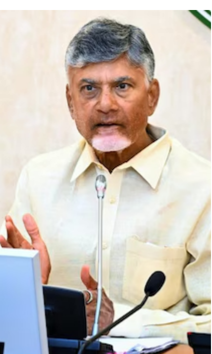
పరిస్థితిని గత ఐదేళ్లలో కల్పించారు. తనపైన హత్యాయత్నం కేసు పెట్టారు. 2019 వరకు తనపై ఒక్క కేసు కూడా లేదు. కానీ గత 5 ఏళ్లలో అక్రమ కేసులు అనేకంగా పెట్టారన్నారు. ప్రభుత్వ వ్యవస్థలు నాశనం అయ్యాయిపై నేను

గృహంలో చిత్తూరు జిల్లా, నియోజకవర్గ అధికారులతో బుధవారం సీఎం సమీక్షా సమావేశం నిర్వహించారు. కుప్పంలో రోడియం, హింస, గంజాయి, అక్రమాలు ఎట్టి పరిస్థితుల్లో కనిపించకూడదు: సీఎం చంద్రబాబు రానున్న రోజుల్లో అమలు చేయబోయే ప్రణాళికపై అధికారులకు దిశానిర్దేశం చేశారు. కుప్పం సమగ్ర అభివృద్ధికి యాక్ష్న్ ప్లాన్ సిద్ధం చేయాలని ఆదేశించారు. తన ప్రాధాన్యం, ఆలోచనలు, నిర్ణయాలకు అనుగుణంగా అధికారులు ప్రతిపాదనలు సిద్ధం చేసి పనులు ప్రారంభించాలని సూచించారు. సమీక్షలో చంద్రబాబునాయుడు మాట్లాడుతూ 7% కుప్పంలో రోడియం, హింస, గంజాయి, అక్రమాలు ఎట్టి పరిస్థితుల్లో కనిపించకూడదన్నారు. రాజకీయ ప్రోద్బలంతో వెళ్లిన తప్పుడు రోడ్ల పనులు ఎట్టి వేయాలన్నారు. రోడియం చేసే వారి పట్ల పోలీసులు కఠినంగా వ్యవహరించాలని తెలిపారు. గత 5 ఏళ్ల అధికారులు మనసు చంపుకుని పనిచేశారు. వైసీపీ నేతల పైకాచి అసందానికి కొందరు అధికారులు సహకరించారన్నారు. నా సొంత నియోజకవర్గానికి నేను రాతేని, మాట్లాడలేని