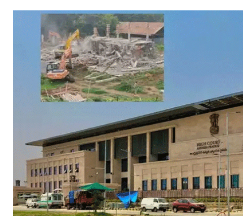
తీసుకోకుండా, అక్రమంగా కార్యాలయాలను నిర్మిస్తున్నారంటూ ప్రభుత్వ అధికారులు పలుచోట్ల వైసీపీ కార్యాలయాలకు నోటీసులు అందించారు. నిర్మాణాలపై వివరణలు ఇవ్వాలంటూ నోటీసుల్లో పేర్కొన్నారు. దీనిపై అధికార డీడీపీ, విపక్ష వైసీపీ నేతల మధ్య సోషల్ మీడియాలో పెద్ద యుద్ధం

అమరావతి జూన్ 26, ప్రజావినికిడి : ఏపీలో వైసీపీ కార్యాలయాల అంతం ఇప్పుడు హాట్ టాపిక్ గా ఉంది. వైసీపీ తమ కార్యాలయాలను అనుమతులు లేకుండా నిర్మించినట్లు డీడీపీ ఆరోపిస్తోంది. ఈ క్రమంలోనే వైసీపీ కేంద్ర కార్యాలయాన్ని కూడా అధికారులు ఇటీవల కూల్చివేశారు. అలాగే వివిధ జిల్లాలలో ఉన్న వైసీపీ కార్యాలయాలకు నోటీసులు అందించారు. ఈ నేపథ్యంలో వైఎస్సార్ సీపీ ఏపీ హైకోర్టు క్లాస్ సూట్ ఇచ్చింది. వైసీపీ కార్యాలయాల కూల్చివేతలపై ఏపీ హైకోర్టు స్టేట్ మెంట్ కోర్ విధించింది. రేపటి వరకూ (జూన్ 27) యథావధిని కొనసాగించాలని ఆదేశించింది. వైసీపీ కార్యాలయాలను కూల్చివేయటం, నోటీసులపై వైసీపీ హైకోర్టు ఈ మేరకు ఆదేశాలు జారీ చేసింది. ఈ అంతం మీద కౌంటర్ దాఖలు చేయాలని ఏపీ ప్రభుత్వాన్ని ఆదేశించింది. వైసీపీ నేతలు