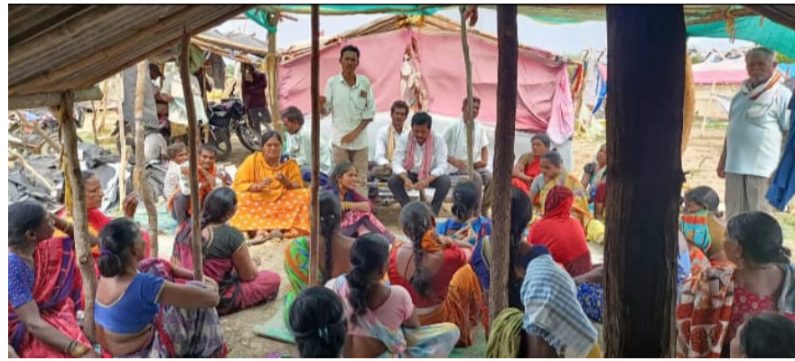
ప్రజావినికిడి, (చెన్నూర్):జూన్ 15:

సిపిఎం పార్టీ రాష్ట్ర కమిటీ సభ్యులు పైళ్ళ ఆశయ్య డిమాండ్..