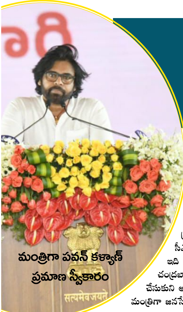
మంత్రిగా పవన్ కల్యాణ్ ప్రమాణ స్వీకారం