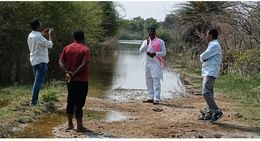
నీటితో నిండి ఉన్న దృశ్యం మాట్లాడుతున్న చిల్కమర్రి..

- ఫలించిన “చిల్కమర్రి” పోరాటం.. - రాకపోకలకు అనుకూలంగా మారిన రోడ్డు.. - బీటీ రోడ్డు నిర్మించాలని డిమాండ్.. - హర్షం వ్యక్తం చేస్తున్న గ్రామస్థులు..